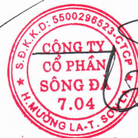
Ngô Quốc Thế